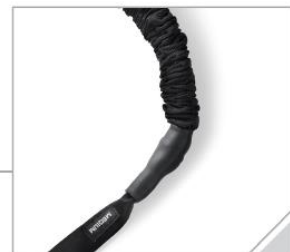
レジスタンスコード ナイロン製の安全スリーブで覆われたレジスタンスコード。万が一、コードが切れてしまっても安全です。コードの強度は5種類。付属品はミディアム。(L, M, H, XH, XXH)