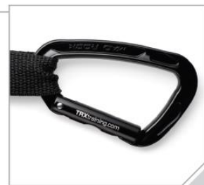
カラビナ 業務仕様の耐久性をもつ頑丈なカラビナ