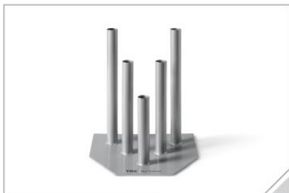
リップトレーナースタンド 最大5つのリップトレーナーを収納可能。強度の異なるレジスタンスコードのついたリップトレーナーをならべて、効率よくトレーニングをすることができます。