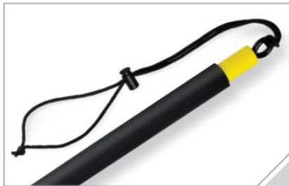
セーフティストラップ トレーニングの安全性を重視。

TRXリップトレーナーベーシックキットはダイナミックで爆発的な回旋系の動きをトレーニングするのに非常に有効なキットです。コアの筋肉やインナーマッスルの強化など、効率的に代謝量の高いトレーニングをすることができます。