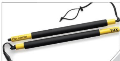
リップトレーナー 丈夫なラバーハンドルがついた1.1mの長さのバー。二つに分解できるので、持ち運びにも便利。